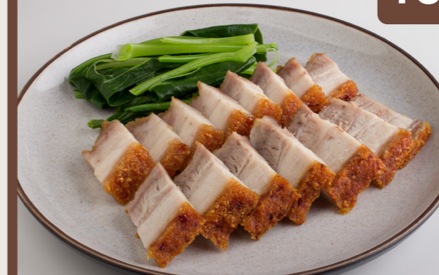
10 Deep Fried Crispy Pork 酥肉 หมูกรอบ