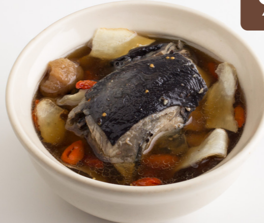
9 Black Chicken with Chinese Herbs Soup 乌鸡汤 ไก่ดำตุ๋นยาจีน