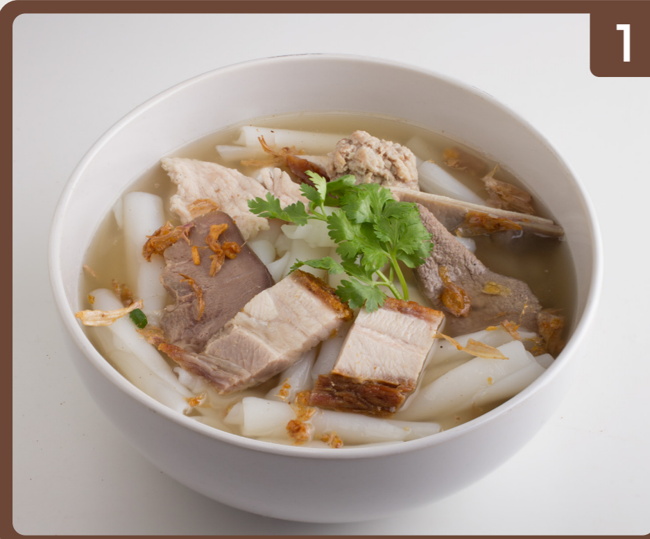
1 Roll Noodles Soup 粉条汤 ก๋วยจั๊บน้ำเย็น