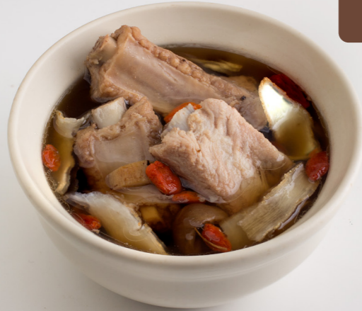
8 Pork Spareribs with Chinese Herbs Soup 猪血汤 ซีโครงหมูตุ๋นยาจีน